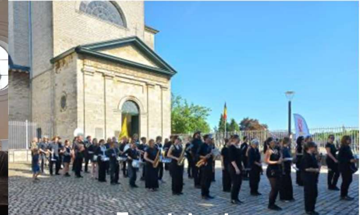
Feeststoet 100 jaar Harmonie Volharding