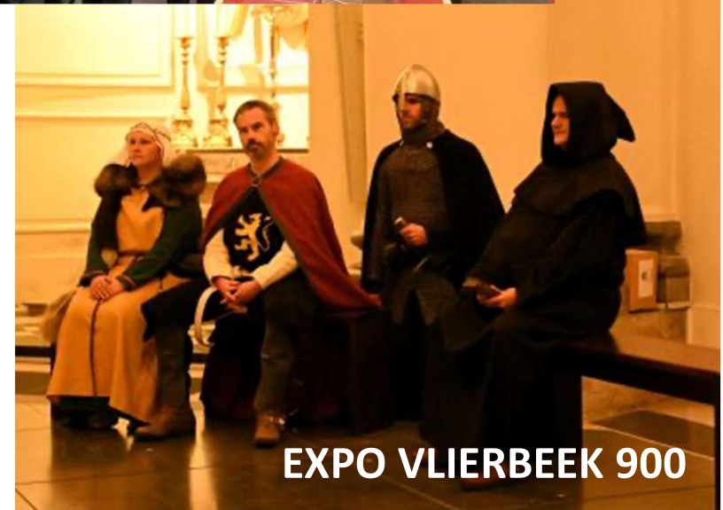
EXPO VLIERBEEK 900