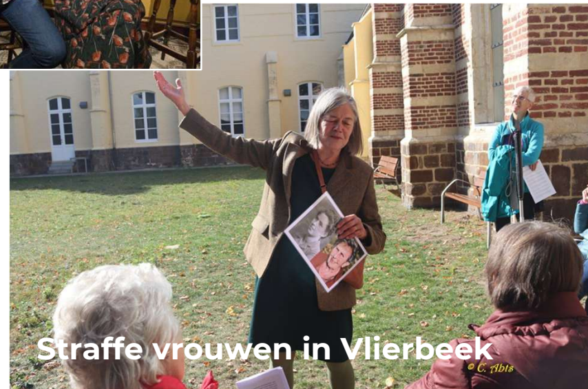
Straffe vrouwen in Vlierbeek