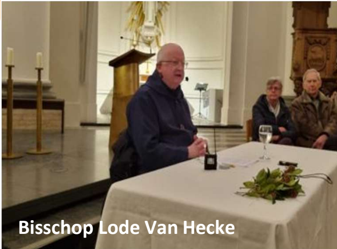
Bisschop Lode Van Hecke