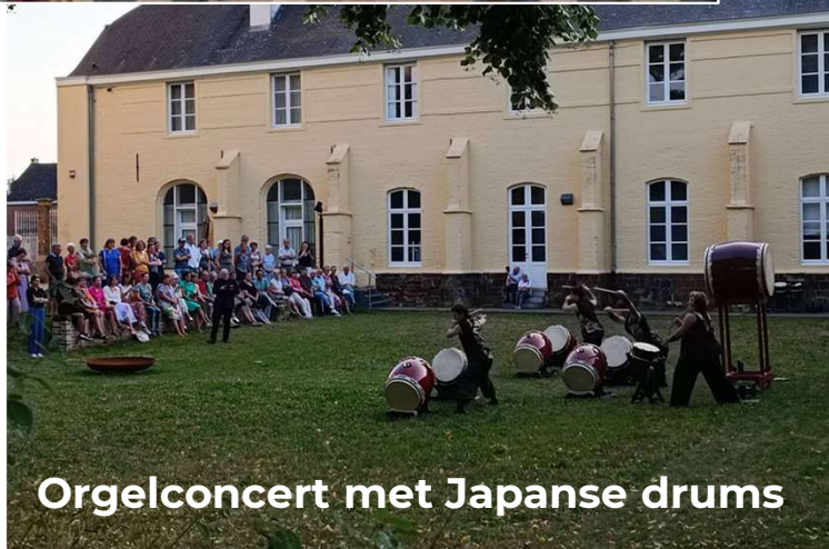
Orgelconcert met Japanse drums