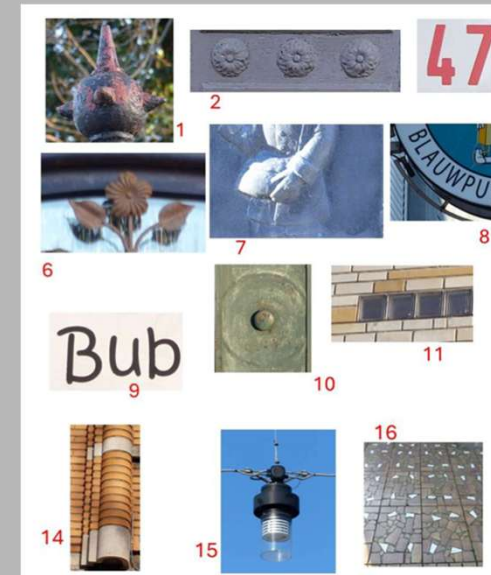
Fotozoektocht Van Trein tot Benedictijn