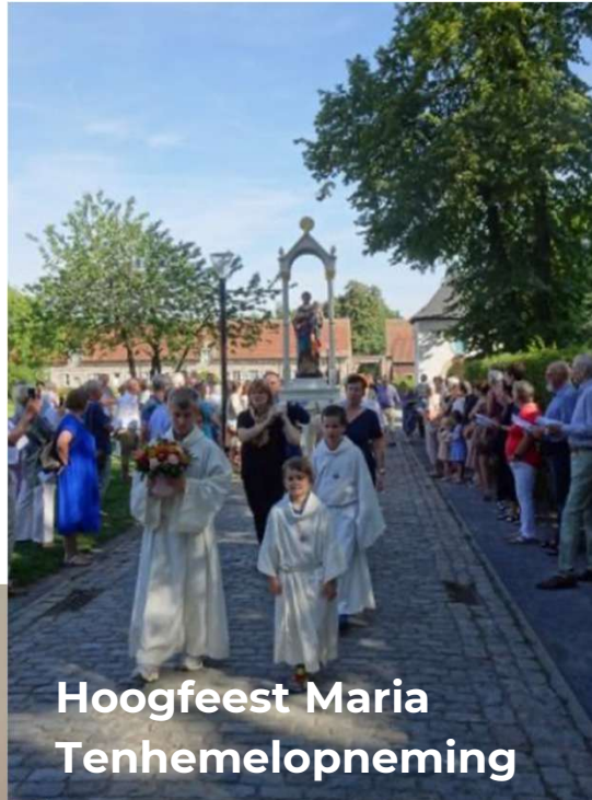
Hoogfeest Maria Tenhemelopneming