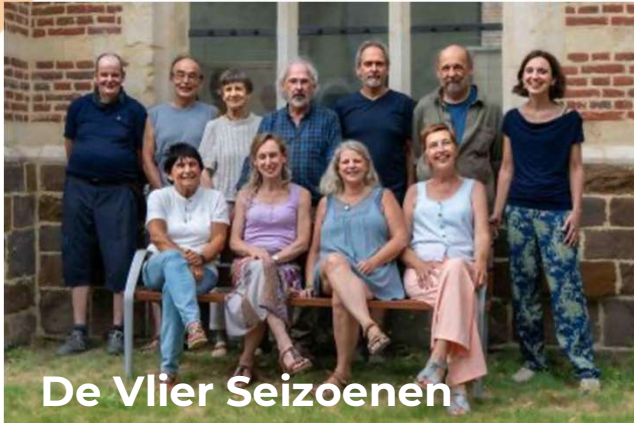
De Vlier Seizoenen