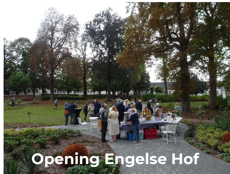
Opening Engelse Hof