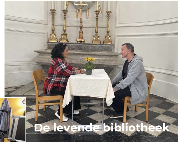
De levende bibliotheek