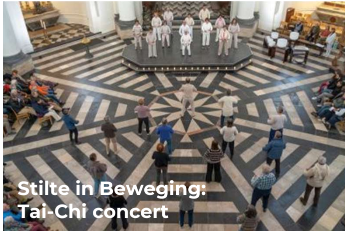
Stilte in Beweging: Tai-Chi concert