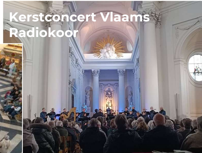
Kerstconcert Vlaams Radiokoor